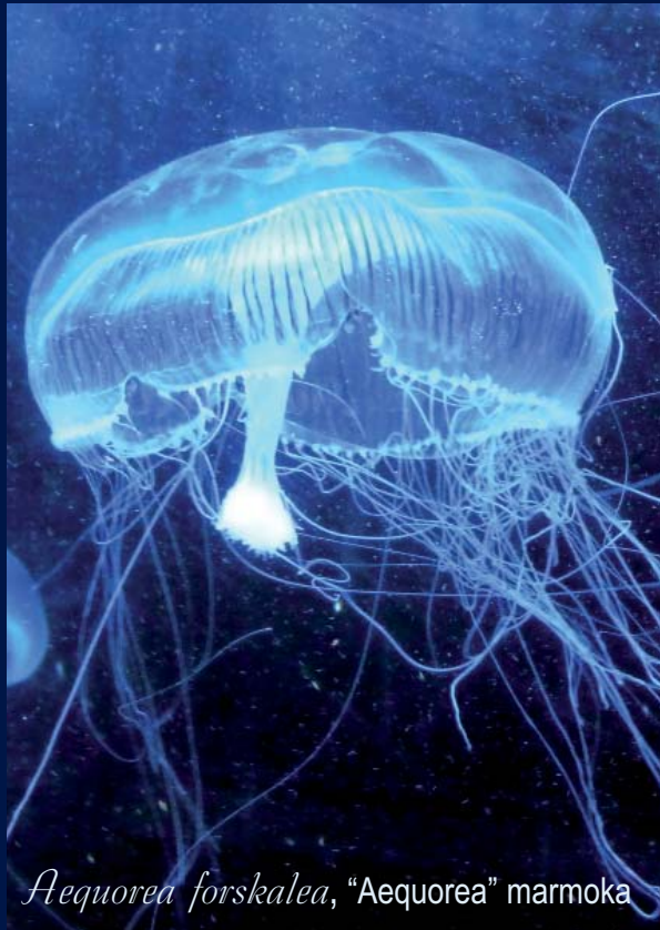
Aequorea forskalea , "Aequorea" marmoka

Nahiz eta marmoken ugalketen arrazoi zehatzak gaur egun ikerketa helburu izan, badakigu ugalketa hauek urtarokoak direla eta beti gertakari natural bat izan direla. Badirudi ugalketa hauek handitzen doazela azken urteotan, eta litezkeen arrazoi bezala adierazten dira: bere harraparien murrizketa, dordoka edo atunak bezala; aldaketak klima-faktoreetan, euri erregimena edo tenperatura globala bezala (ziur aski klima-aldaketari loturik); berezitasun hidrografikoak, hala nola lur iturrietatik eratorritako kutsadura.