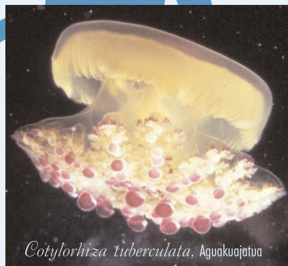
Cotylorhiza tuberculata , Aguakujatua

Marmoken kanpainaren asmoa kostalde espainiarrean marmoken agerpena zaintzea eta begiztatzea da, eta orokorrean ez dago hauek kentzeko asmorik. Azken kasu honetan, Ingurumenaren eta Landa eta Itsas Ingurumenaren Ministerioa salbuespenez eta egoera puntualetan jardungo da bakarrik, kanpainaren protokoloetan esaten dena kontuan hartuz.