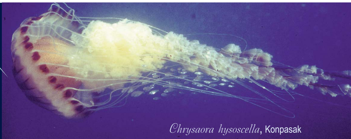
Chrysaora hysoscella , Konpasak