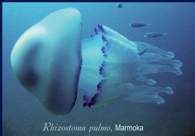
Rhizostoma pulmo , Marmoka